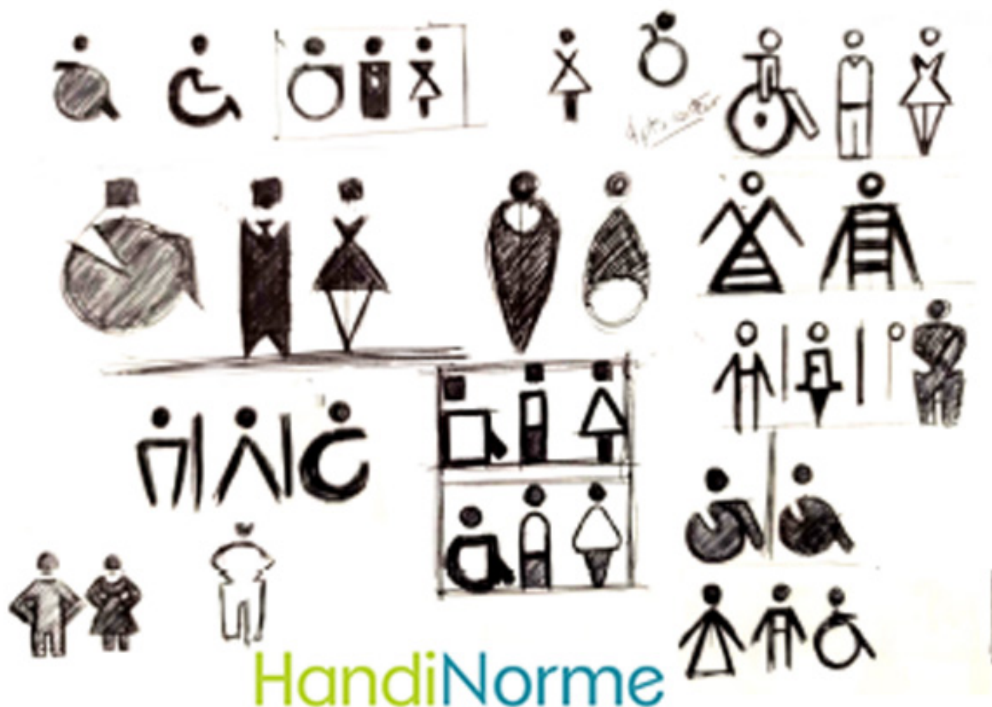
Tableau des déclinaisons possibles

Réf. 4281264 Matériau - Vinyle souple autocollant